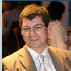
Robert Schreiber Thannhauser + Ulbricht Straßen- und Tiefbau GmbH

„Das Mittelstandsforum bietet die Möglichkeit, seine rosarote Brille abzusetzen, die man zwangsläufig im Laufe der Zeit entwickelt. Eine optimale Veranstaltung, an der ich gerne wieder teilnehmen würde.“