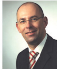
Autor: Prof. Dr. Ralf-Peter Oepen, Betriebswirtschaftliches Institut der Bauindustrie GmbH (BWI-Bau).

Grundsätzlich gelten für die Zuordnung der oben genannten Sachverhalte in den verschiedenen Kreditinstitutsgruppen vorgegebene Gliederungsvorgaben und Richtlinien. In vielen Banken werden aber Auslegungsspielräume zugelassen. Wir haben in verschiedenen Gesprächen z. B. mit dem Deutschen Sparkassen- und Giroverband (DSGV) immer wieder auf diese Problematik hingewiesen, mit der Folge, dass bspw. im EBIL-Leitfaden des DSGV den Sparkassen